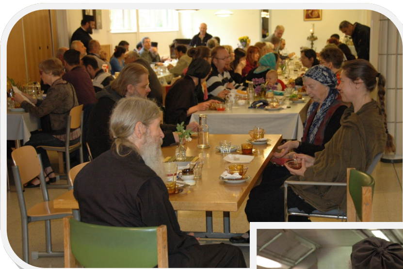
Luostarikeskuksen ruokalaa ja keittiötä