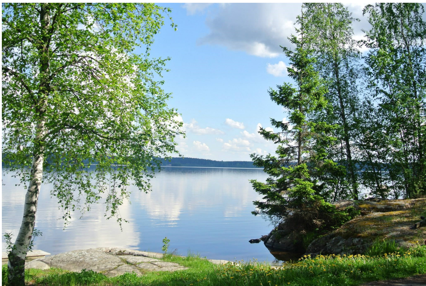
Näkymä Pääjärvelle Luostarikeskuksen saunarannasta